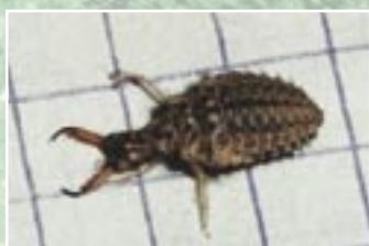
Skudrlauvas ( Myrmeleon formicarius ) kāpurs