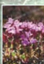
Mārsils ( Thymus )