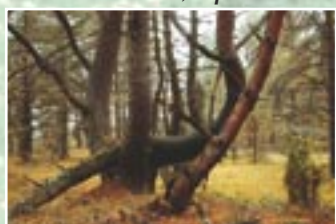
Vecās priedes ir dzīvesvieta retām dzīvnieku sugām