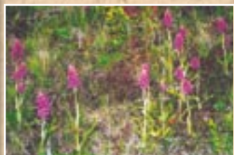
Stāvlapu dzegužpirkstīte ( Dactylorhiza incarnata )