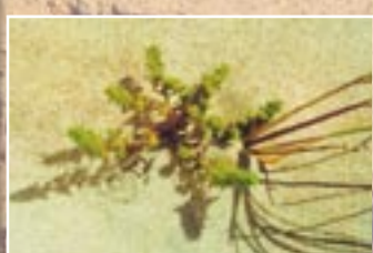
Kālija sālszāle ( Salsola kali )