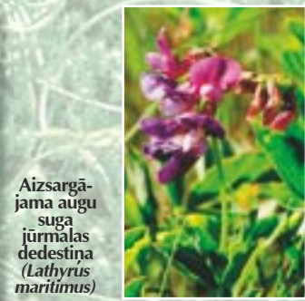
Aizsargājama augu suga jūrmalas dedestīna ( Lathyrus maritimus )