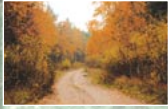
Meža ceļš rudenī