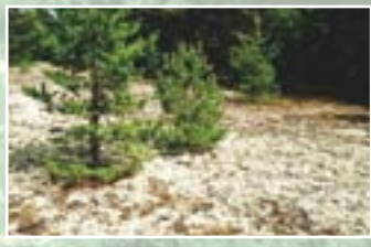
Pelēkā kāpa ar ķērpjiem