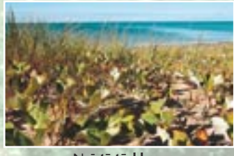
Neistā tūsklape ( Petasites spurius )