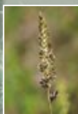
Zilganā kelērija ( Koeleria glauca )