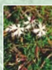
Smiltāja nelķe ( Dianthus arenarius )