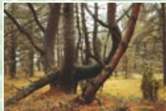
Vecās priedes ir dzīvesvieta retām dzīvnieku sugām