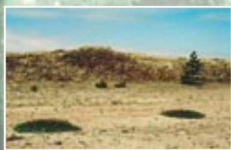
Spilvenveida augājs pelēkajā kāpā