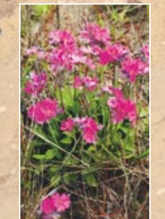
Bezdelīgactiņa ( Primula farinosa )

Jūras piekraste Ziemepe ir ļoti neparasta. Te redzami krasti, kādu nav nekur citur Latvijā. Pie jūras iepreti Ziemeupes baznīcai pludmale robežojas ar stāviem noskalošanas krastiem. To augstums svārstās no 5 līdz 12 metriem. Pēdējo gadu laikā jūra sauszemei dažviet atņēmusi vairāk kā 10 metrus platu joslu. Vietām vēl šobrīd turpinās krasta nogrūvumi. No Tenkšu grāvja uz ziemeļiem noskalošana nav tik aktīva un tāpēc stāvkrasts apaudzis ar augiem. Maijā krasta rotā bezdelīgactiņas, jūnijā tur redzamas bagātīgi ziedošu orhideju audzes (dzegužpirkstītes), kā arī parastās kreimules un citi kalķainu vietu augi. Šādas augu sabiedrības jūras krastā Latvijā ir ļoti reti sastopamas. Tas saistīts ar īpašajiem augšanas apstākļiem: zilā māla stāvkrastā iztek avoti, nodrošinot gan mitrumu, gan arī barības vielas. Tālāk uz Žožu pusē, kur jūras krasts periodiski tiek noskalots, saaugušas māllepēs, dažādi kāpu un pļavu augi. Stāvkrastā mājvietu iekārtojušas krasta čurkstes.