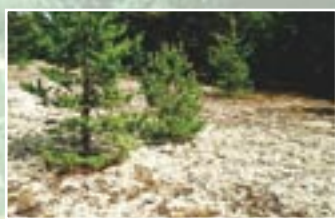
Pelēkā kāpa ar ķērpjiem