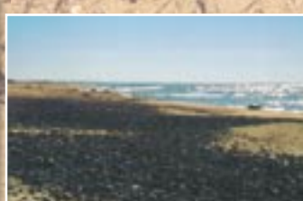
Pludmale ar oļiem

Visbiežāk Ziemeupes pludmalē sastopama Baltijas šķēpene. Tas ir viengadīgs augs ar pārveidotām, sulīgām lapām un sārti violetiem, smaržīgiem ziediem. Nereti šķēpenei līdzās aug kālija sālszāle, kurai arī ir pārveidotas lapas, tikai ar dzeloni galā. Gan šķēpene, gan kālija sālszāle ir halofīti - augi, kas spēj augt sāļās augsnēs.