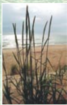
Smiltāju kāpukviesis ( Leymus arenarius ) embrionālās kāpās