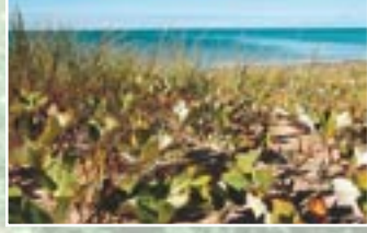
Neistā tūsklape ( Petasites spurius )

Krasta posmā starp Ziemepe un Akmeņragu ir izveidojušas daudzveidīgas pelēkās kāpas. Tās redzamas gan virs stāvkrastiem, gan arī starp priekškāpām un mežu. Vietās, kur pelēkās kāpas ir vecākas un smilšu kustība pierimusi, augāju veido ķērpji, sūnas, zemi sauso pļavu un kāpu augi. Tur līdzās aug divmāju kakpēdiņa, jūrmalas pārkoņamoliņš, smiltāja nelķe un pūsmēness ķekarparade. Taču pelēkajās kāpās, kuras pakļautas periodiskai smilšu pārpušanai, vairāk