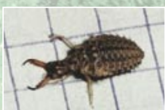
Skudrlauvas ( Myrmecoleon formicarius ) kāpurs