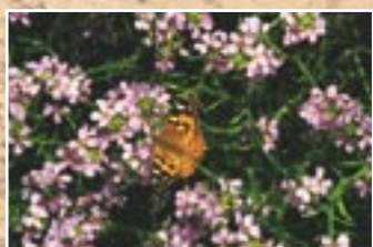
Baltijas šķēpene ( Cakile baltica )