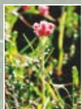
Divmāju kakpēdiņa ( Antennaria dioica )