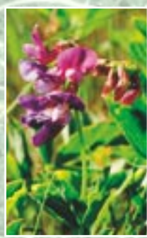
Aizsargājama augu suga jūrmalas dedestīna ( Lathyrus maritimus )