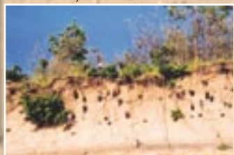
Šeit ligzdo krasta čurkstes