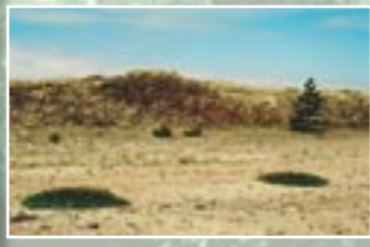
Spilvenveida augājs pelēkajā kāpā