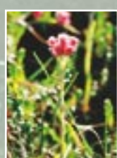
Divmāju kakpēdiņa ( Antennaria dioica )